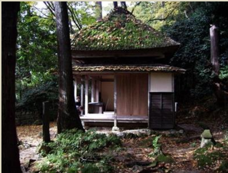
五合庵 Gogō-an, Rjókan remetekunyhója 1804-től 1816-ig élt itt, (1914-ben újjáépítették)

ぬす人に取り残されし窓の月 nsubito ni / tori nokosareshi / mado no tsuki kirabolt kunyhóm ablakába beragyog az ottfelejtett hold