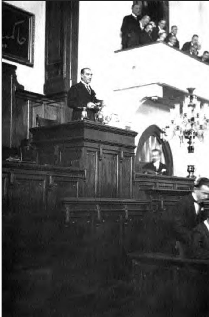
1927. október Gazi Mustafa Kemal a Köztársasági Néppárt 2. Nagy Kongresszusán a később könyv alakban is kiadott híres beszédét mondja