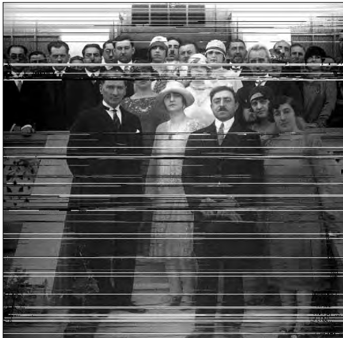
1928. május Gazi Mustafa Kemal Amanullah Han afgán király és felesége tiszteletére adott fogadáson