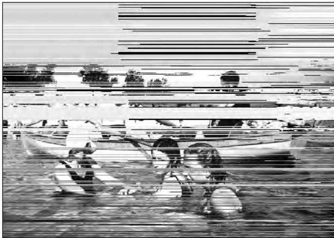
1936. június Atatürk Afet Inannal Floryában evez