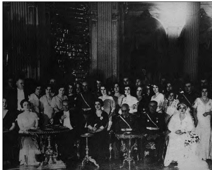
Atatürk İzzettin Çalýhar tábornok leányának lakodalmán