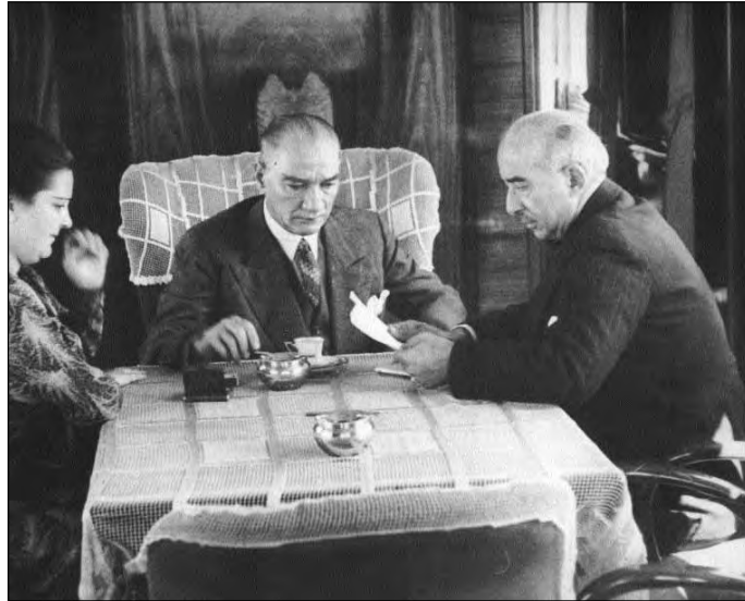
1934 Atatürk İsmet İnönüvel és Afet İnan történészsel vonaton Isztambulba utazik