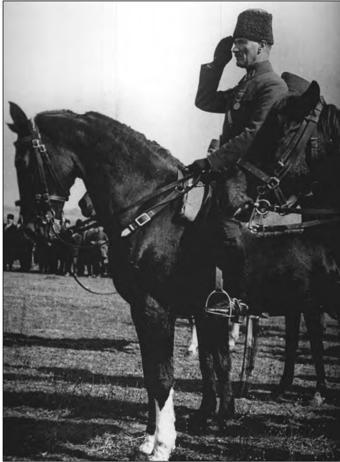
1923. február Mustafa Kemal főparancsnok az ankarai Ciftlik pályaudvar melletti hadgyakorlaton