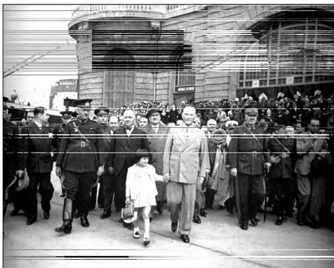
1929. augusztus Gazi Mustafa Kemal az isztambuli Haydarpasa pályaudvaron Kazim Ózalppal és a fogadására összegyűltekkkel