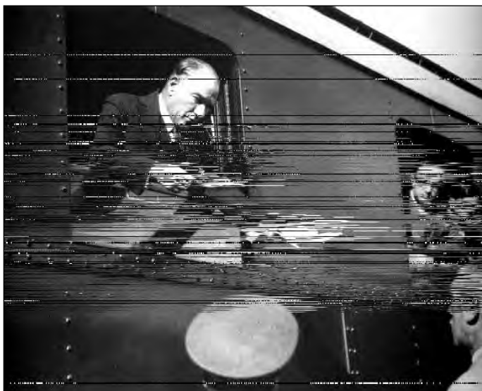
1933. január Gazi Mustafa Kemal a pályaudvaron egy állampolgár kérvényét olvassa és megfelelő utasításokkal látja el