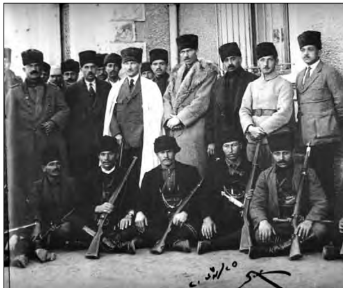
1920 Mustafa Kemal az ankarai pályaudvaron lévő főhadiszállás épülete előtt Çerkez Ethem-mel és barátaikkal