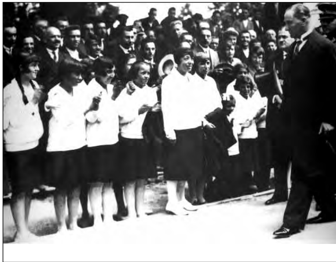
1928. június Gazi Mustafa Kemal üdvözlí az 5t Izmitben nagy szeretettel fogadó diáklányokat és tanáraikat