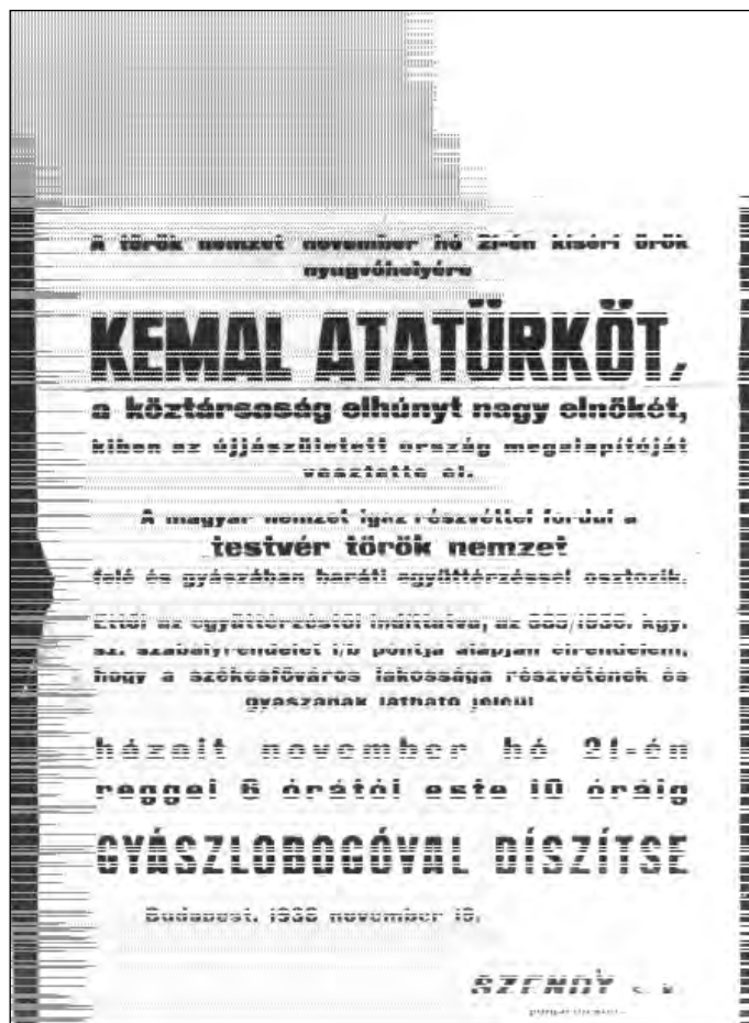
Atatürk halála alkalmából a Magyar Kormány Budapesten fali hirdetőményt tett közzé