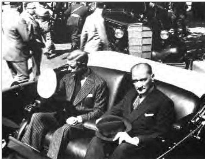
1936 szeptember Atatürk az angol királlyal a Galatasaray Gimnázium előtt hajt el