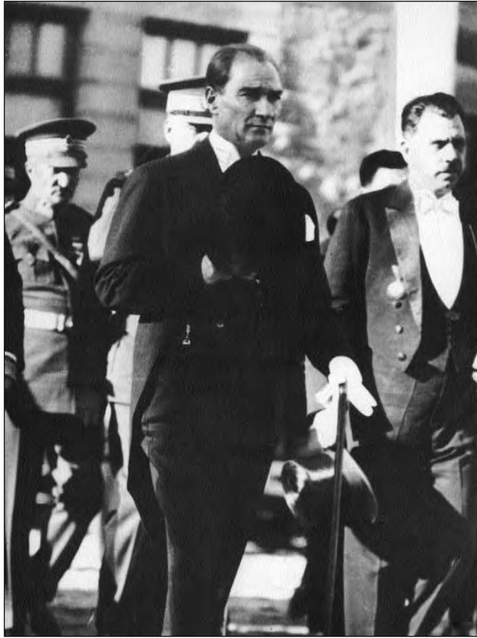
1936. október 29. Mustafa Kémal fogadta a gratulációkat a köztársasági ünnep alkalmából, majd Kézim Özalppal a Parlament elnökével együtt elhagyja a Parlamentet