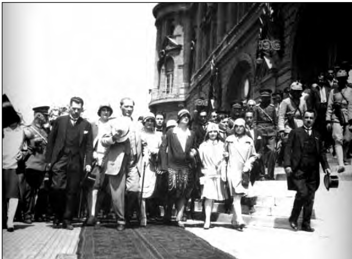
1929. augusztus Gazi Mustafa Kemal az isztambuli Haydarpasa pályaudvaron Kazim Özalppal és a fogadására összegyűltekkkel