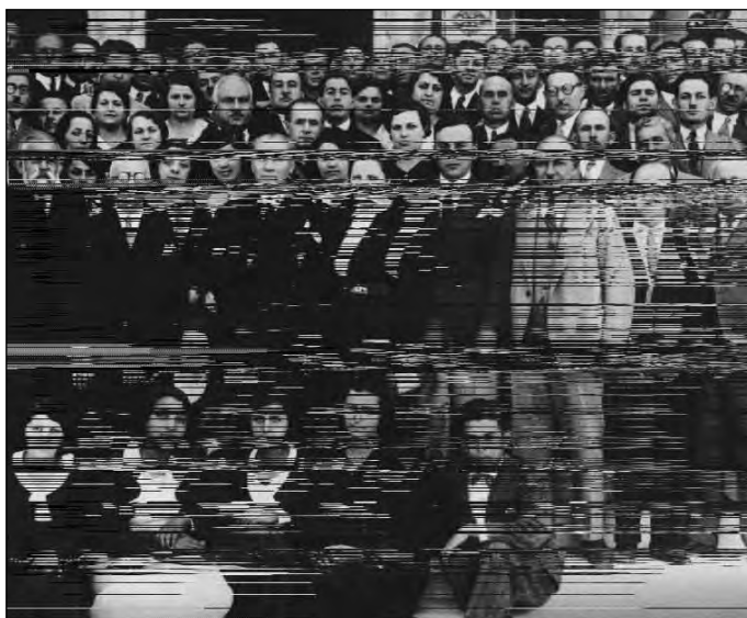
1932. július 9. Mustafa Kemal pasa a Történelmi Társaság tagjaival