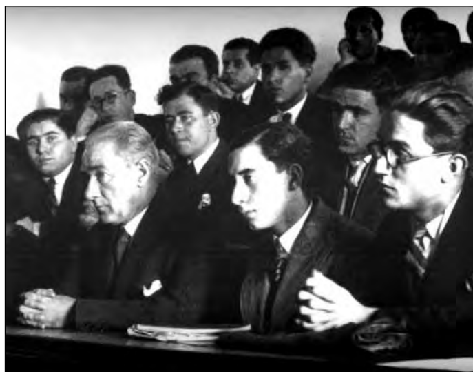
1930. december Gazi Mustafa Kemal az Isztambul Egyetem Jogi Karának első éves hallgatóival előadást hallgat