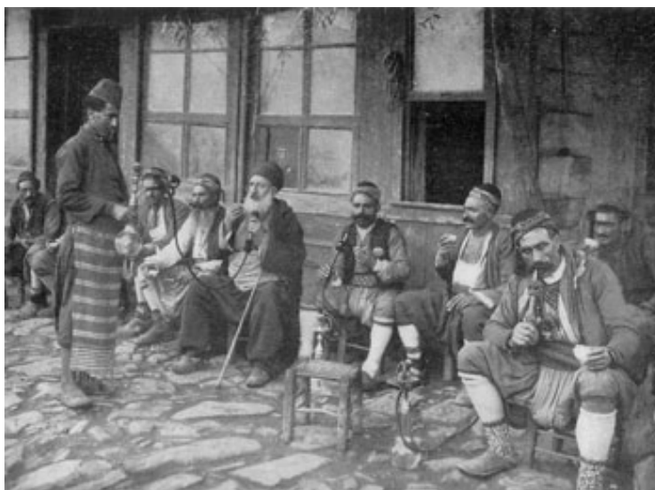
3. kép: Oszmán kávéházi jelenet. (ÜNVER, SÜHEYL: Türkiye’de Kahve ve Kahvehaneler. Türk Tarih Kurumu, Ankara 1963).