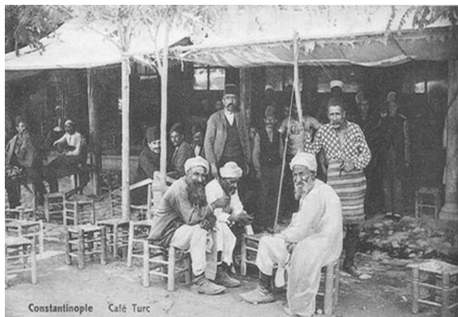
2. kép: Játék a kávéházban. (HEISE, ULLA: Kahve ve kahveaneler. Dost Kitabevi, Ankara 2001).

„A fürdő a férfiaknak is egyik fő élvezetök, és még a kávéház, melynek száma Constantinápolyban több ezerre megy. Minden ötven lépésre találsz egyet; a piacokon, a bazárok, mint a mosék mellett s a tengerparton egymást érik; künn a vidéken nincs egy szép hely, nincs kioszk-csoport építve egy domb tetején, nincs pázsit egy csörgő patak partján, nincs fok, mit gesztenyék s platánok árnyékoznak be, mint nincs oly szegény falu, melynek a maga kávéháza meg ne volna. Török neve azt jelenti: "az ismeretek iskolája." És valóban, a középosztálynak s a népnek e hely az, mi nálunk a kör és casino; mert ha keveset olvas, annál kíváncsibban hallgatja mindazt, mi ajakról ajakra hagyományképpen száll. Napi munkájok után az emberek itt gyülekeznek össze, s közlik egymással a legújabb híreket, nemcsak ismerőseikről, nemcsak magáncselekedteikről, de itt veszik bírálat alá a kormány tetteit s a birodalom közügyeit. Hajdan e gyülekezetekből eredtek a mindenható janicsárok lázadásai, azon összeesküvés is, mely II. Ozmánt trónjától megfosztá, egy kávéházban alakult. Testvére IV. Amurat, 1623-ban bosszúból valamennyi kávéházat bezárattott, mint 1828-ban Mahmud is, ki a janicsárok kiirtása után jól tudta, hogy a régi rendszer titkos hívei s a dervisek a kávéházakból izgatnak. De a nép