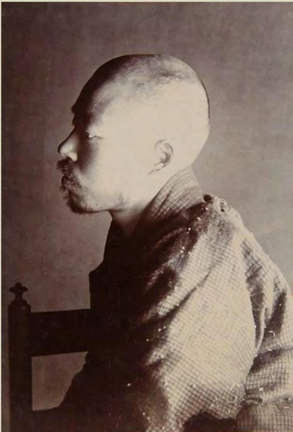
Shiki utolsó portréja, 1900. december 24.