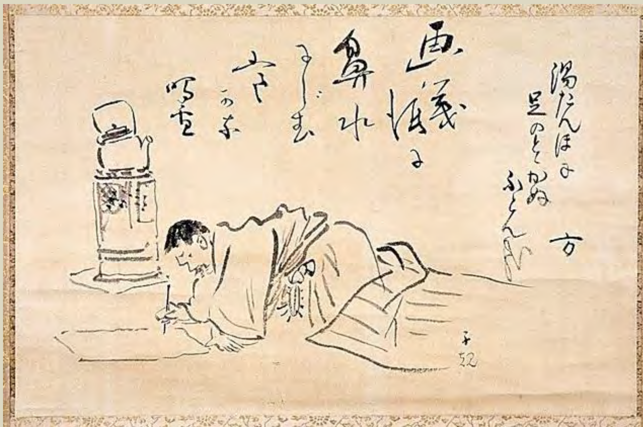
A betegen fekvő Shiki lerajzolja magát