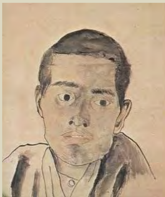
Shiki önarcképe, 1900