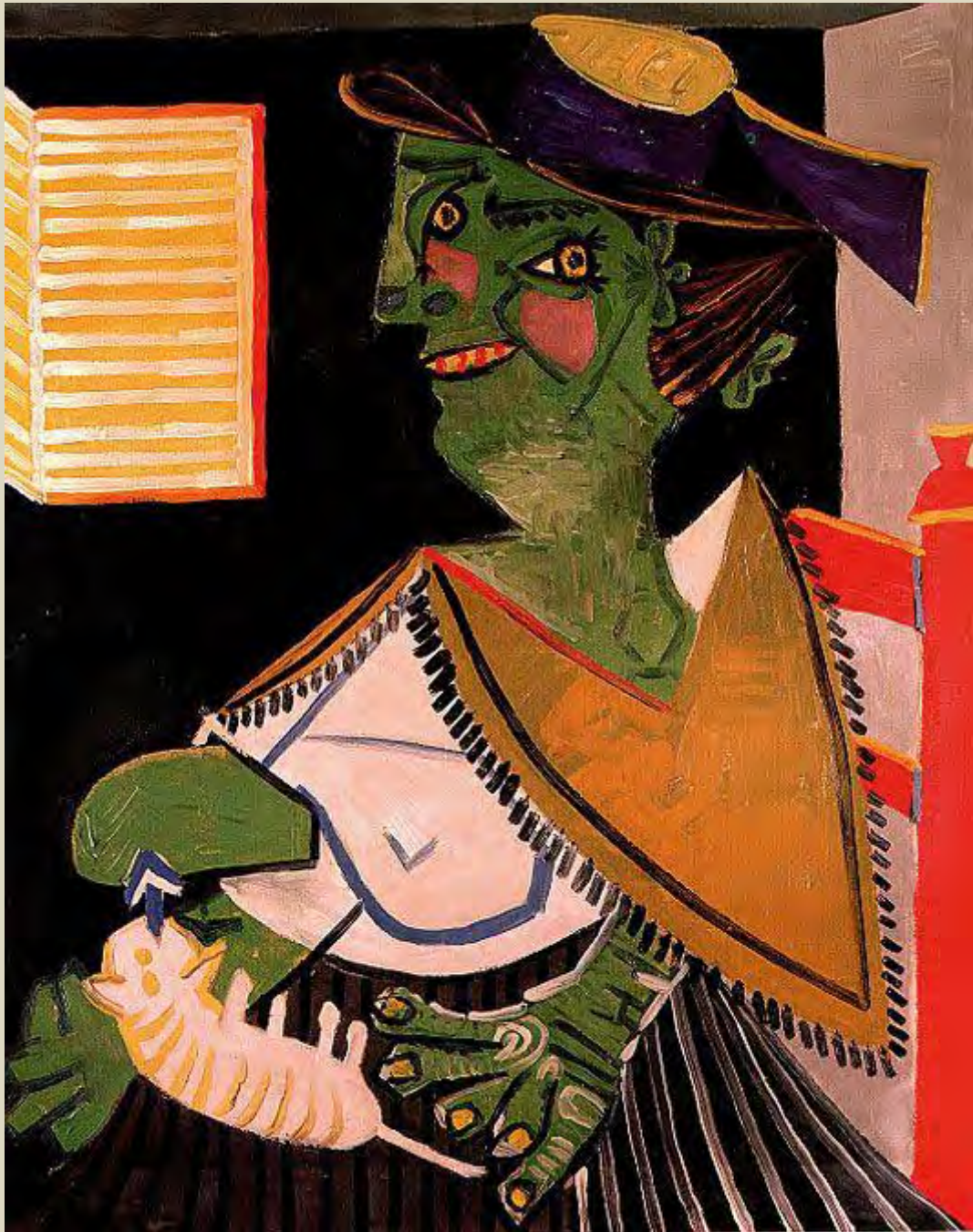
Éluard vu par Picasso, 1937