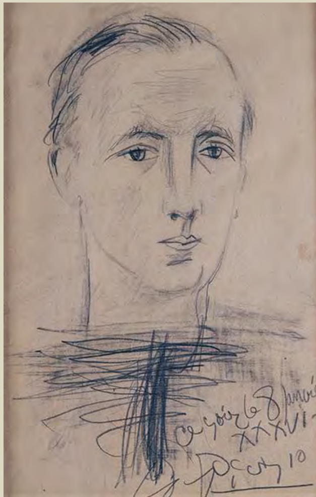
Pablo Picasso: Deux Portraits de Paul Éluard