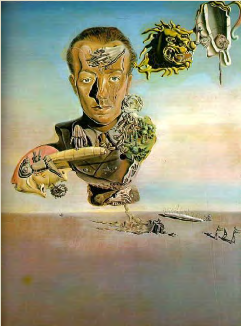
Éluard vu par Dalí, 1929