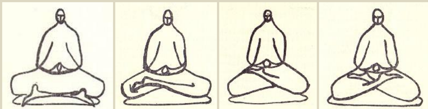
A lábtartás fokozatai

Ikegami (1968) három ülésmodot hasonlított össze: a zen meditációban használt fél ill. teljes lótuszülést (半跏趺坐 hankafuza ill. 結跏趺坐 kekkafula ), a sarkon-ülést (正座 seiza ) és a „törökülést” (胡座 agura , 安座 anza ). Ez az utóbbi kettő használatos leginkább a gyékénypadlójú japán lakásban, ahol lapos párna szolgál szék helyett. Ikegami statikailag a kekkafulát találta a legstabilabb üléstípusnak, mert a két térd és az ülep alkotta háromszög majdnem egyenlő oldalú.