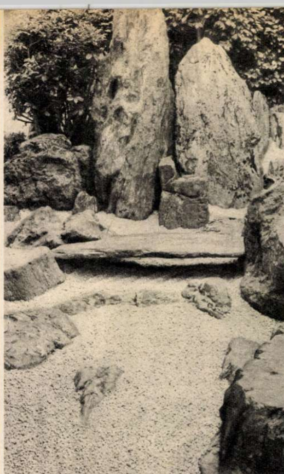
Daiszen-in első kertje. Az élet forrása

A Daiszen-in kolostornak tulajdonképpen három kertje van. Az első a templomcsarnok északi sarkát veszi körül L alak-