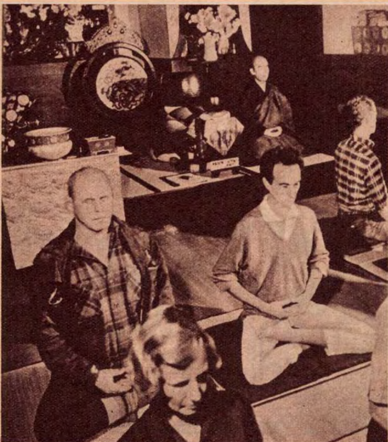
Közös meditáció a San Franciscó-i Zen kolostorban