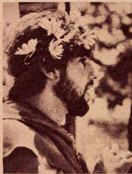
Virággal a hippik-gyűlésen

A buddhizmus az ó-ind vallások lélek-vándorlás hitének megújítójaként lépett fel. A brahmanizmus lélek-vándorlás hite az embert kétségbeesítő filozófia rabjává tette. E hit szerint csupán a test halandó, ám az elhunyt lelke — érdemei vagy bűnei szerint — új testbe költözik. Az új test lehet féreg, hal, oroszlán, madár, herceg, király vagy isten teste is. A különböző fokozatokat tehát az életben szerzett érdemek döntenek el, a bűnös alacsonyabb rendben születik újjá, az ére-nyes magasabb rendbe léphet. A meg-