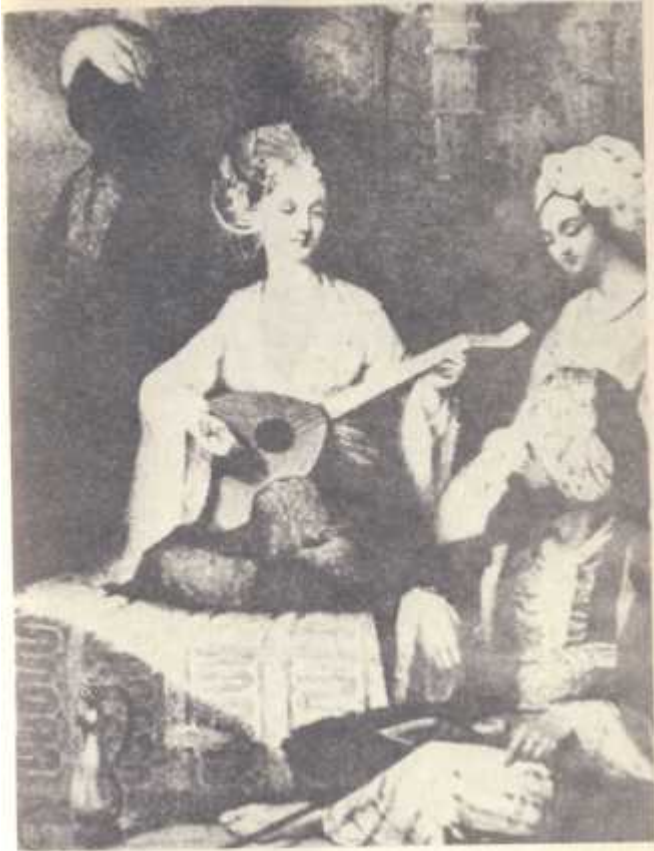
Életkép a háremből

Ez a fantázia szülte anekdota is bizonyoság arra, hogy mily mértékben foglalkoztatta már a négy évszázaddal ezelőtt élő magyarok képzeletét is a háremek titokzatos világa. Ezt a momentumot építette bele különben Móricz Zsigmond is az Erdély-trilógiának azon jelenetébe, ahol Géczi András – Báthory Gábor kegyeltje, majd az ellene szőtt merénylet egyik tervezője – keleti buja történetekkel szórakoztatja a fejedelmet és udvarát. A rengeteg egykorú forrást áttanulmányozó regényíró erről szólva megjegyzi: „Ez időben a törökösség, mint valami édes méreg csiklandozta a keresztyén, főként a protestáns úri rend kíváncsiságát... A török rendkívüli hatalma, mindent eltipró, mindenben uralkodó ereje imponált, s a törökkel való személyes érintkezés ízt adott titkos keleti bujaságok, gyönyörök élvezetéből. A megfoghatatlan varázsa nagyobb, mint az ismereteknek lenyűgözése.”