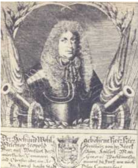
Leopold Beck tábornok, Buda első császári parancsnoka