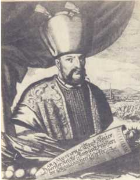
Kara Musztafa nagyvezér

A szultán hallgatott; helyette a nagyvezér felelt, elmondva, hogy Magyarország régóta a szultán tartománya, s bizonyára Bécs és Lengyelország is nemsokára osztozni fog annak sorsában. A szultán csak adófizető királyokat tűr meg a földön.