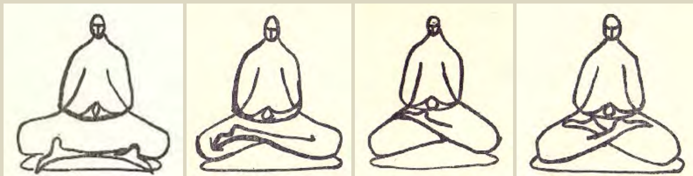
A lábtartás fokozatai

Ikegami (1968) három ülésmodot hasonlított össze: a zen meditációban használt fél ill. teljes lótuszülést (半跏趺坐 hankafuza ill. 結跏趺坐 kekkafula ), a sarkon-ülést (正座 seiza ) és a „törökülést” (胡座 agura , 安座 anza ). Ez az utóbbi kettő használatos leginkább a gyékénypadlójú japán lakásban, ahol lapos párna szolgál szék helyett. Ikegami statikailag a kekkafulát találta a legstabilabb üléstípusnak, mert a két térd és az ülep alkotta háromszög majdnem egyenlő oldalú.