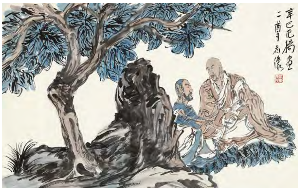
二尊者像 70 × 44 cm