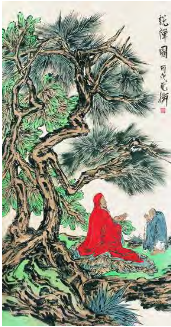
说禅图 180 × 90 cm