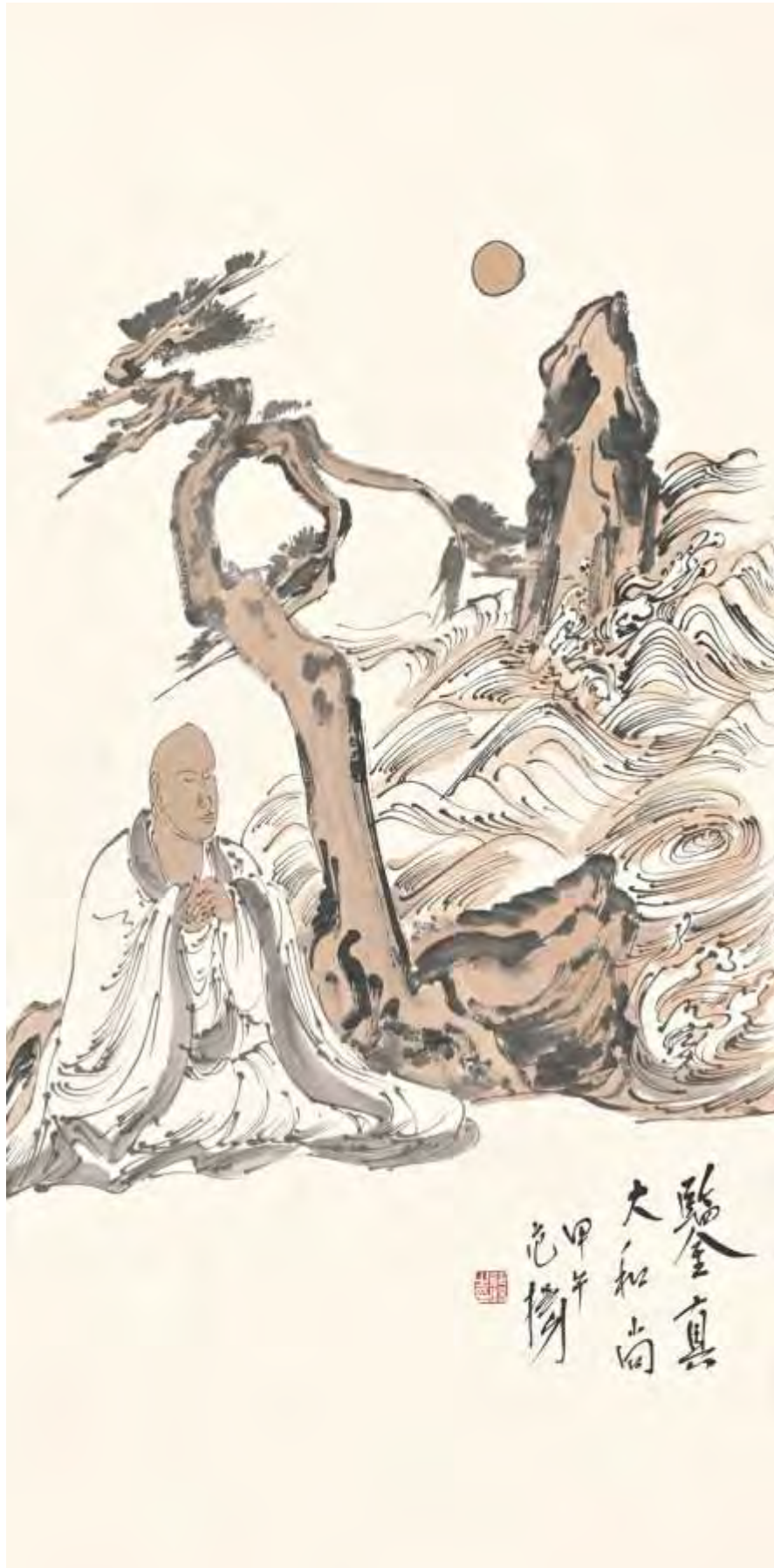
鉴真大和尚 范扬 Jianzhen or Ganjin (688-763)