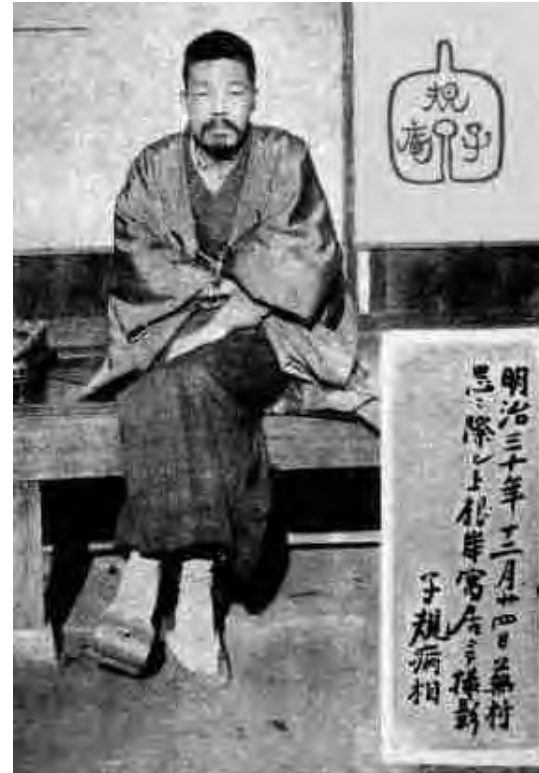
1897. december 24.