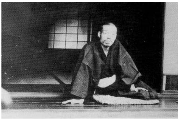
1899. június 19.