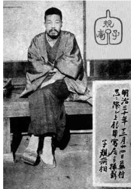
1897. december 24.