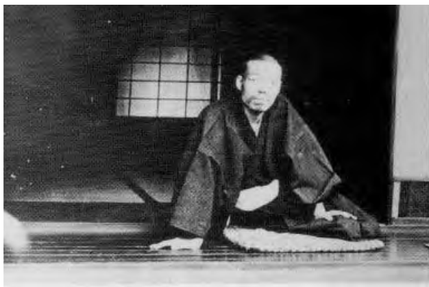
1899. június 19.