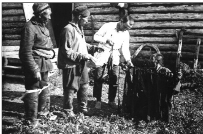
Altaj kizsi szellemábrázolások