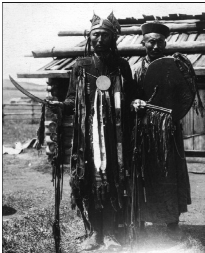
Hingani (?) evenki sámán és segítője