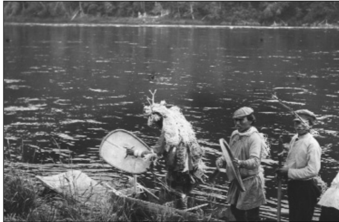
Orocs sámán és segítói