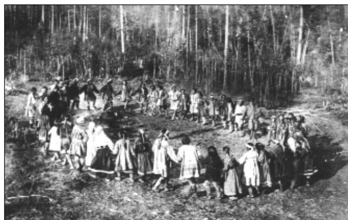
Evenki körtánc: johar