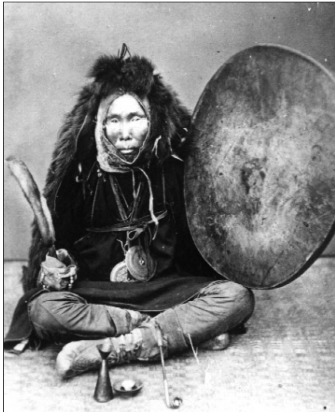
Gilják (nyivh) sámán