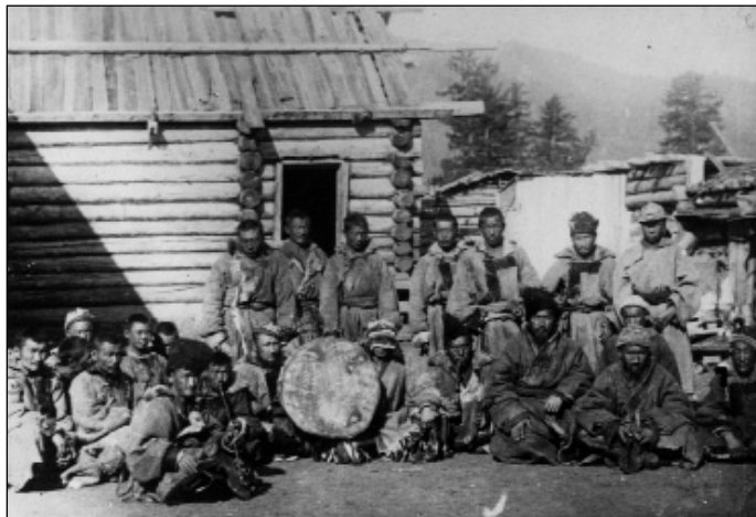
Altaj kizsi urjanhaj sámán