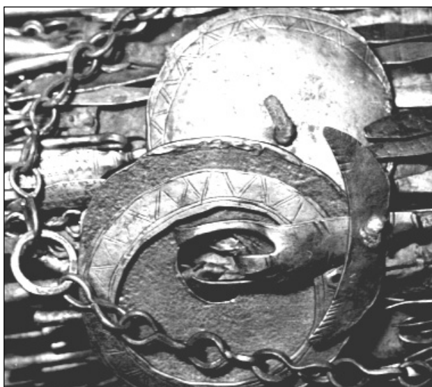
Jakut sámánköpeny díszítés