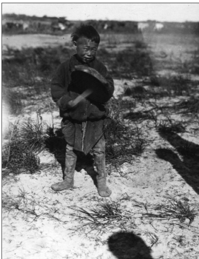
Belső-mongol kisfiú sámánokkal játszik