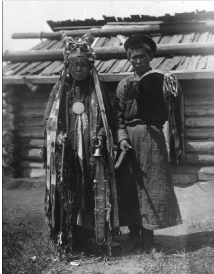
Hingani (?) evenki sámánasszony és segítője