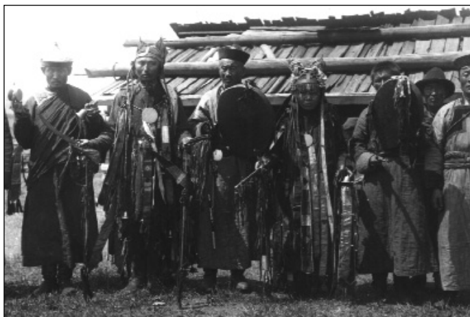
Hingani (?) evenki sámánok