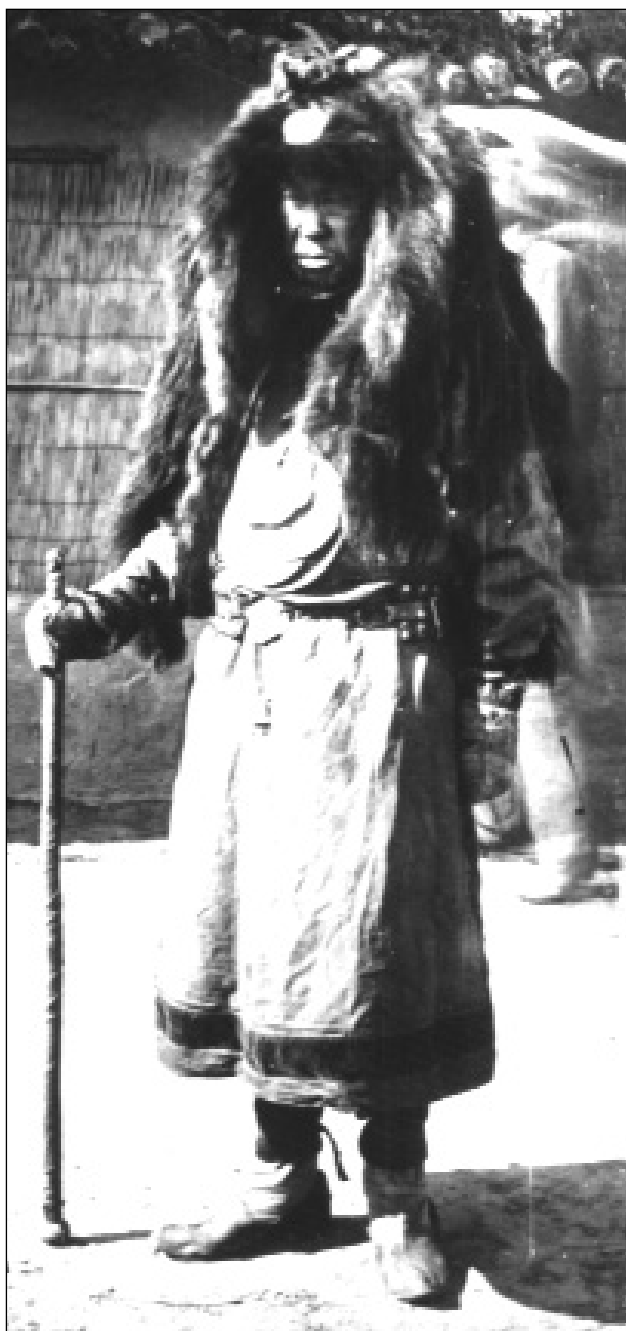
Amur menti sámán