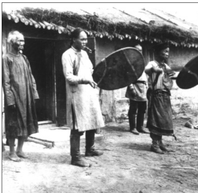
Amur menti sámánok