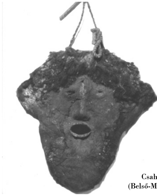
Csahar álarc (Belső-Mongólia)