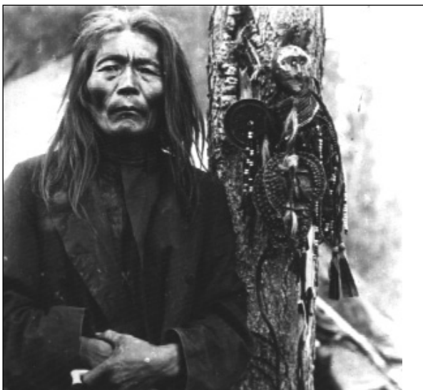
Evenki sámán amulettjeivel