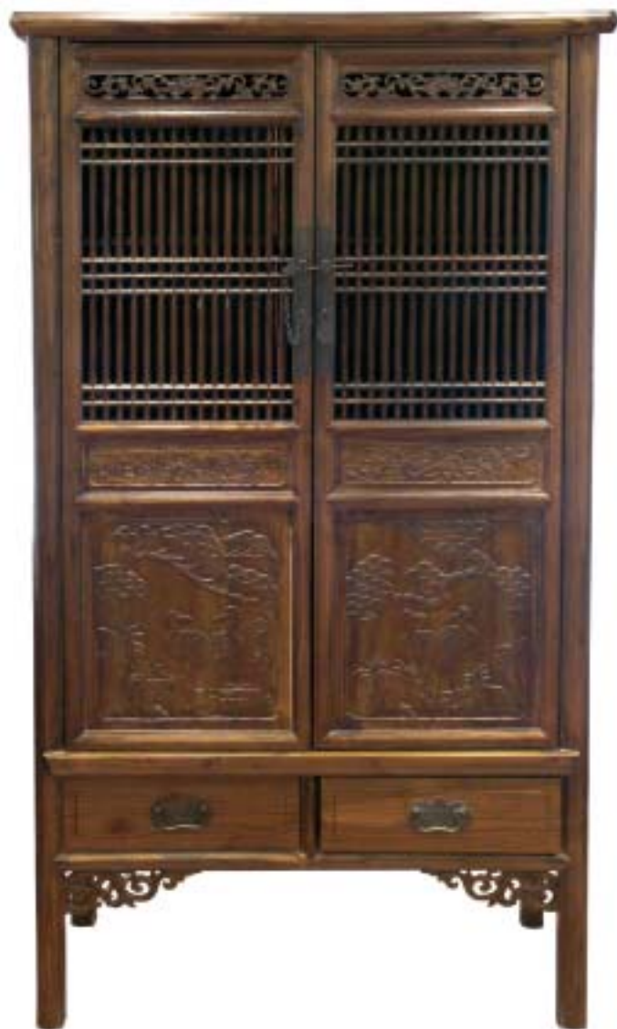
XX. század. Női hálószoba seelyemanyag és ruhanemű tároló szekrény (Terebess Tárlat)

magas széken való ülés teljesen általánossá vált a magasabb társadalmi osztályok tagjai között. Egyszerre használtak alacsony lábú, illetve magasabb felépítésű bútorokat. Az emberi arányok figyelembevételével egy sereg új bútortípus született. A magas és alacsony kialakítású bútorok évtájszerint is elkülönültek, hiszen a hidegebb északi területeken, a fűtött téglalából épített emelvényen, a kangan folyt a mindennapi élet. A kangan a bútoroknak mindig rövid lábuk volt. A Szung-kor (960-1279) társadalmi stabilitása ismét utat nyitott a kézművesség, a művészetek és a bútorművesség fejlődéséhez. Egyre népszerűbb a székek mint általános ülőalkalmatosság. Ez maga után vonta a töb-