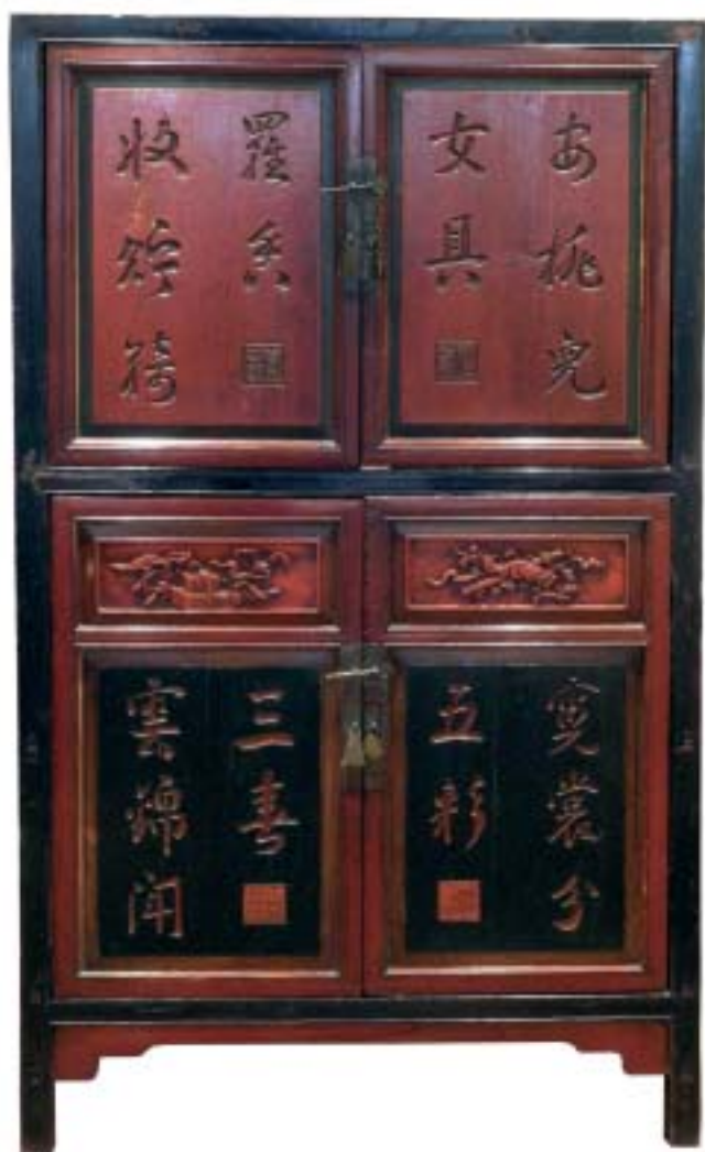
XX. század. Tekercskép- és könyvtároló szekrény (Terebess Tárlat)

A BÚTÖRÖK MEGVÁSÁROLHATÓK A TEREBESS TÁRLAT ÜZLETBEN. (1056 BUDAPEST, IRÁNYI U. 20.)