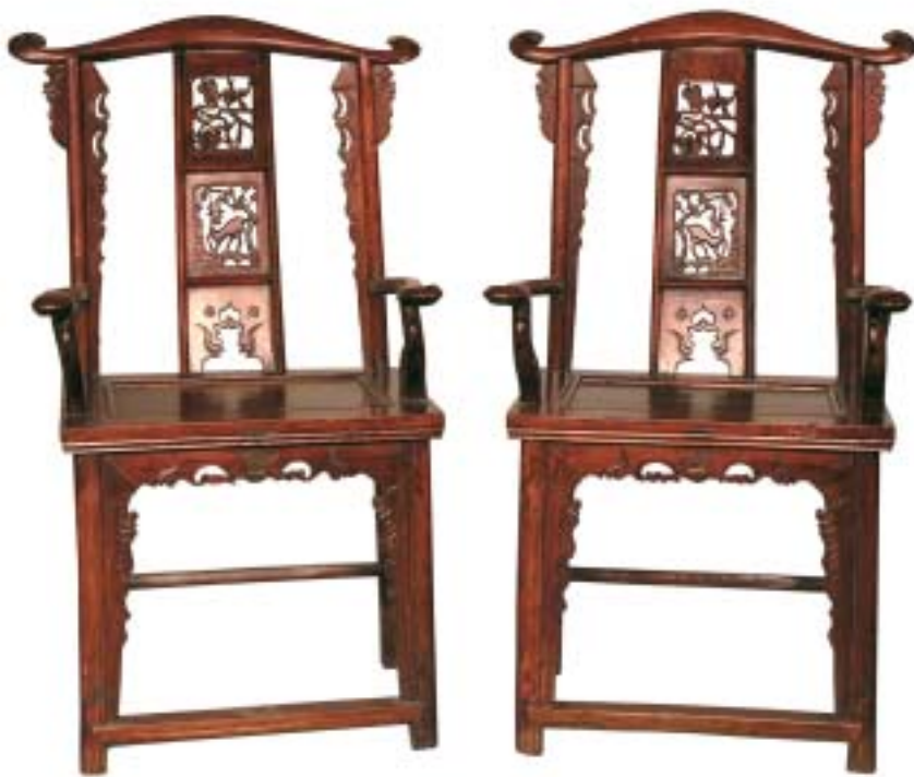
XX. század. Hivatalnok főveg formájú szék pár (Terebess Tárlat)

korából származó sírok leletei. Ezekből a sírokból nagy mennyiségben kerültek elő lakkbútorok, főleg asztalok, kisebb asztalkák, fából készült ágyak. A bútorokat lakkozták és festették. A lakkot először a bútor faanyagának