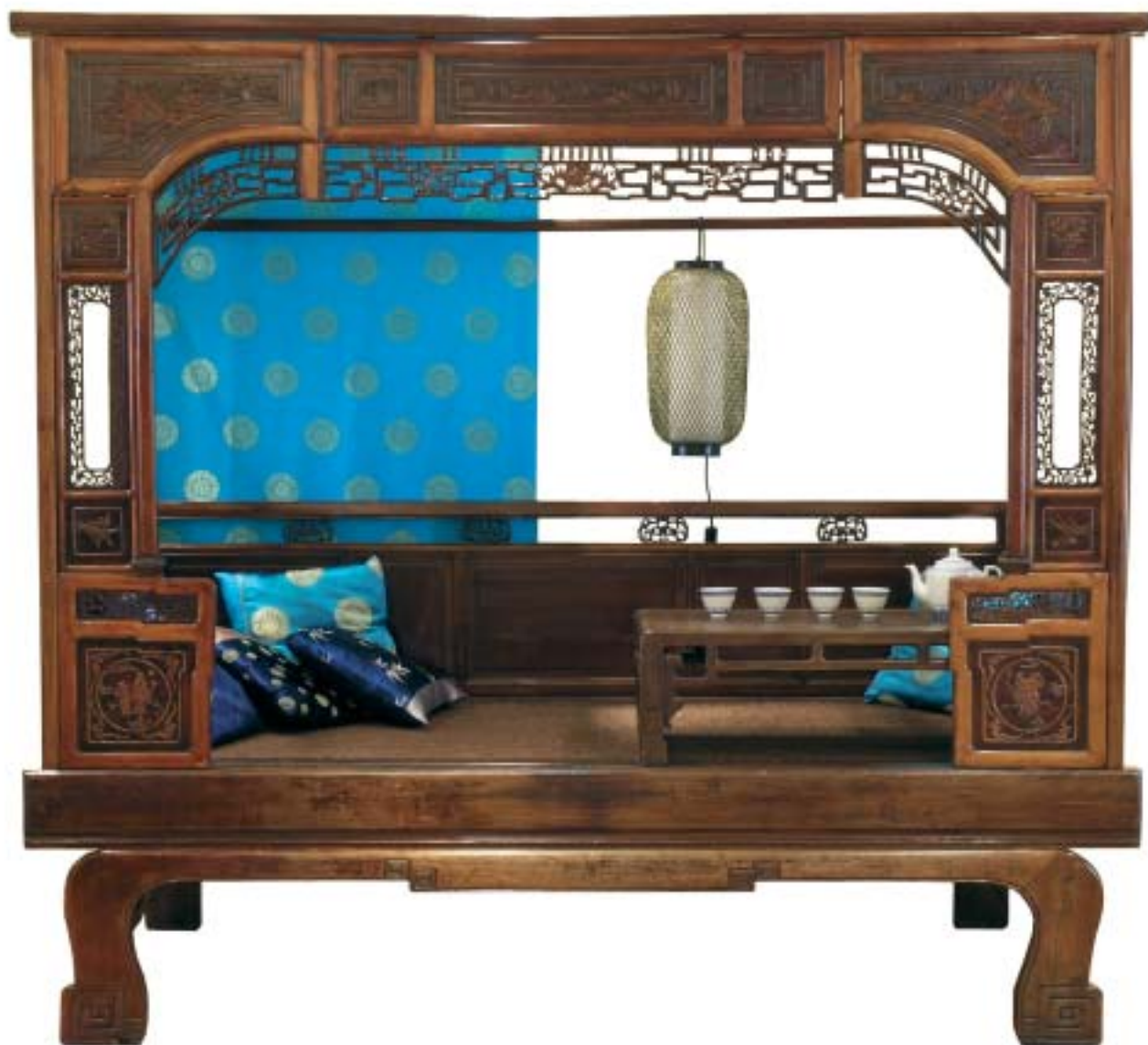
XX. század. Baldachinos ágy, faragott elemekkel (Terebess Tárlat)

konzerválására használták, később már önálló esztétikai szerepet kapott, festették, színezték, faragták. Külön említést érdemelnek a vörös lakk bútorok, melyek nagy megbecsülésben részesültek. Az építészet és a fémöntés módszereinek fejlődésével olyan újabb fagegmunkáló eszközök jöttek létre, melyek hozzájárultak a bútorművesség továbbfejlődéséhez.